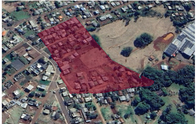
ANEXO II – MAPA DO NÚCLEO URBANO APÓS LEVANTAMENTO